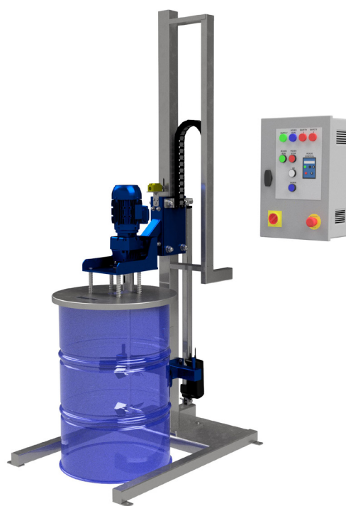
Stacja mieszania do beczek