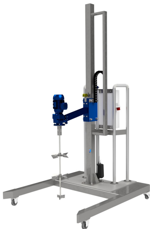
Mobilna stacja mieszania